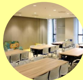
▲会場の開放スペース “みりおん”

11月25日(月) ← 11月5日(火) 申込開始 12月16日(月) ← 12月5日(木) 申込開始