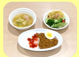
▲カレー(季節により 具材は異なります)